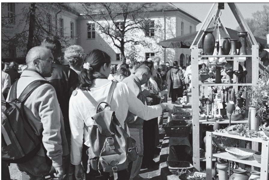
Großer Andrang: 1. Königlicher Wusterhausener Keramikmarkt 2005

Der Markt ist am Samstag, 29. April, von 10 bis 20 Uhr und am Sonntag, 30. April, von 10 bis 18 Uhr geöffnet. Der Eintritt kostet an beiden Tagen 1,00 Euro. Kinder bis 14 Jahre haben freien Eintritt.