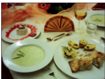
Dafür gab es den 2. Platz beim Regionalfinale des Erdgaspokals der Schülerköche.