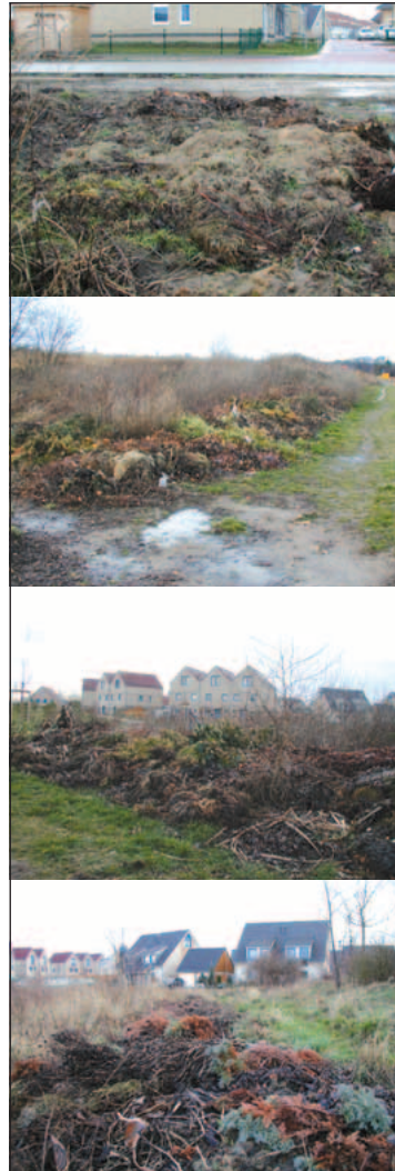
Nicht immer weggucken! Nur zwei Beispiele: Am Weinberg und Beethovenring

Die dabei anfallenden Abfälle gehören auf den Kompost, in eine Kompostieranlage oder können über den Abfallentsorger gesondert entsorgt werden. Sie gehören nicht in öffentlichen Anlagen, auf Grünflächen oder in Wälder.