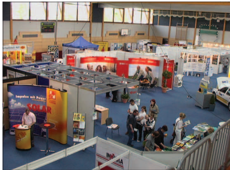
Dahmeland-Messe 2006: Zum ersten Mal ein festes Dach über dem Kopf.

Auch in diesem Jahr wird die Messeteilnahme ortsansässiger Unterneh-