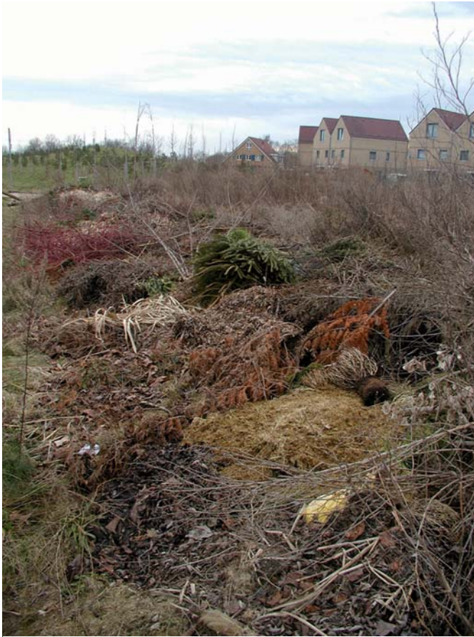
Auch organische Abfälle können sich schädlich auf die Natur auswirken

stärkt gearbeitet. Es werden die Gehölze beschnitten, der Rasen vertikutiert und abgeharkt, die ersten Beete bestellt. Jeder Gartenbesitzer sollte sich die Vorzüge der Kompostierung im eigenen Hausgarten vergegenwärtigen. Darüber hinaus besteht grundsätzlich auch die Möglichkeit, die Gartenabfälle in den ordentlichen Kompostieranlagen abzugeben bzw. über den Abfallentsorger gesondert abfahren zu lassen.