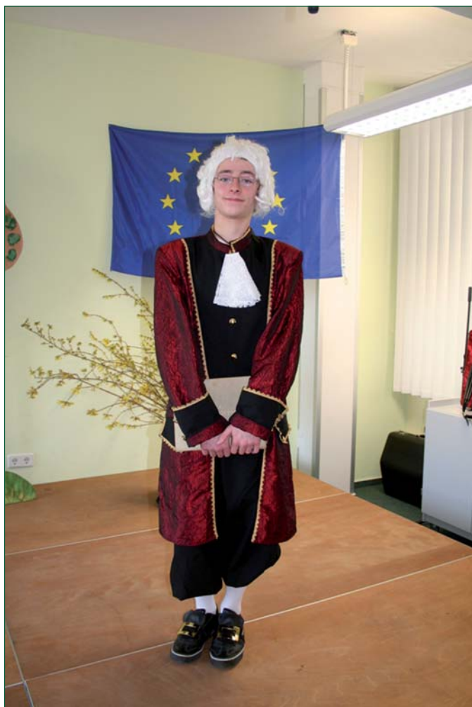
Teil des Festprogramms: Johann Gottfried Herder vor der Europafahne

Herder, der große Humanist, wäre sicher stolz gewesen auf die Königs Wusterhausener Schule, die seinen Namen trägt.