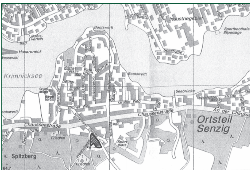
Gebietsabgrenzung zum Entwurf der Klarstellungs- und Einbeziehungssatzung „Gussower Straße“ im OT Senzig